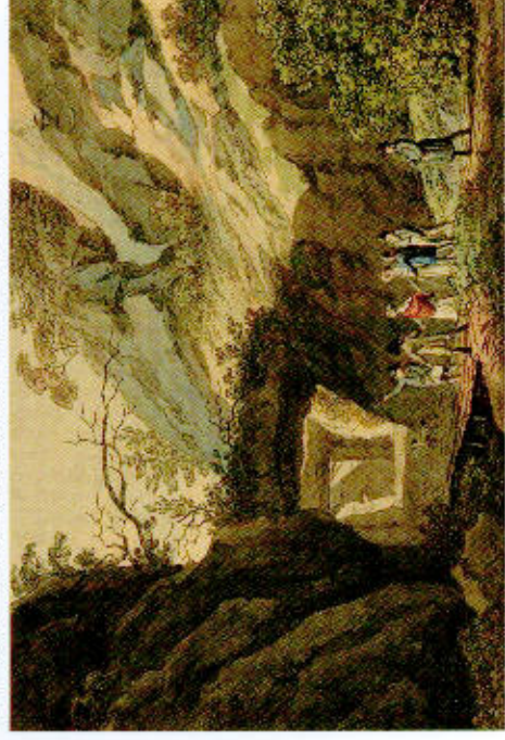
Johann Gottfried Jenitzsch: Ullswaldener Felsensthor, Kupferst., um 1820