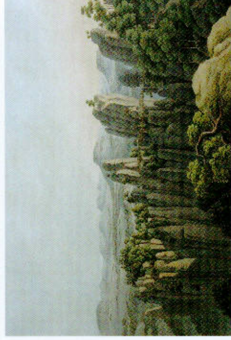
Carl August Richter: Basteiaufsicht, Kupferstich, um 1830