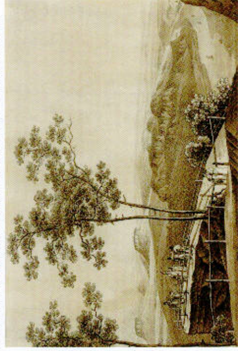
Adrian Zingg: Basteiaussicht, Umfrägenung, sepia, um 1820