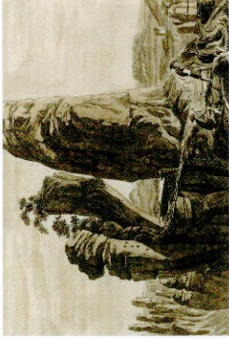
Adrian Ludwig Richter: Neurathener Felsenthor, Kupferstich, 1821