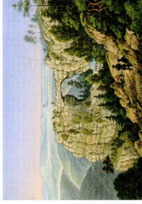
anonym: Probuschtor von Costen, Lithographie, Mitte 19. Jh.