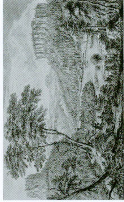
Johann Alexander Thiele: Königstein und Lilienstein, Kupferst., 1726