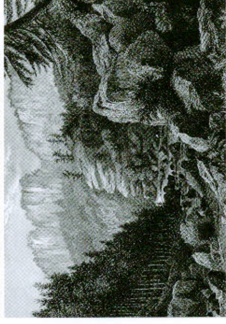
Capon, Robert Barry: Im Tiefen Grund, Stahlstich, um 1830